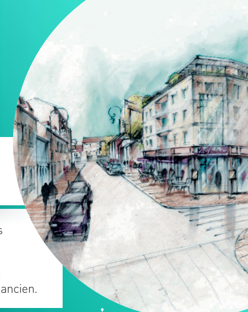
Vue depuis la rue des Fontaines vers la rue du Moutier