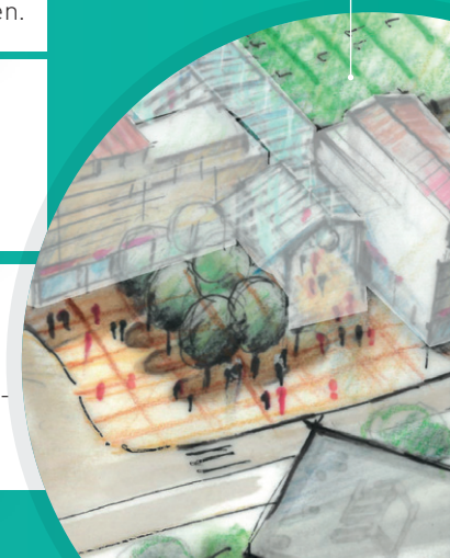
Place du marché